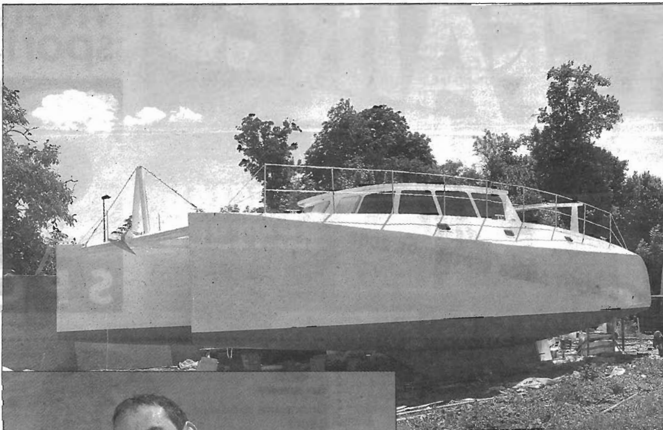
13,90 m de long, 7 m de large et un poids à vide de 6,5 tonnes, le catamaran en impose.

« Déjà, comment construire un bateau ? Il y a quelques années, j'ai fait des recherches, discuté avec des spécialistes. Le bateau idéal me semblait être un catamaran, plus spacieux, plus léger qu'un monocoque et possédant une très bonne visibilité sur la mer. A l'époque, on ne trouvait quasiment pas de plans sur le marché