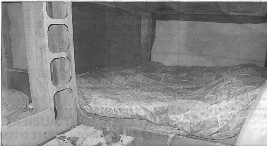
L'une des cabines de couchage, encore à l'aménagement.

Gendarmerie, le bateau ne sera mis à la mer qu'à l'automne. Auparavant, il reste encore les finitions de l'aménagement intérieur, le ponçage, les peintures, la pose du mat et les réglages de l'accastillage.